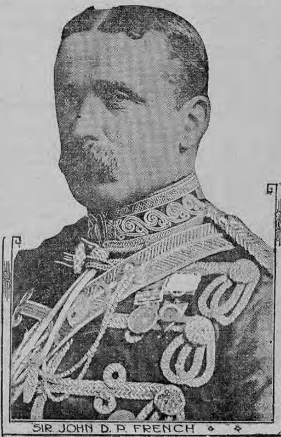
SIR JOHN D. P. FRENCH

backward and inward toward the town, but before the movement could be completed an attack was ordered from the center on the Boers, who were still tentatively holding on to a rear-guard position.