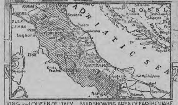
KING and QUEEN OF ITALY MAP SHOWING AREA OF EARTHQUAKE

Bajo las órdenes directas del Rey y la Reina de Italia se inició principio a la obra de socorrer a las víctimas del terremoto. Esta obra se ha llevado adelante con la mayor rapidez. Muchos millares de habitantes han quedado sin hogar y otros tantos están contusos y muchísimos han muerto.