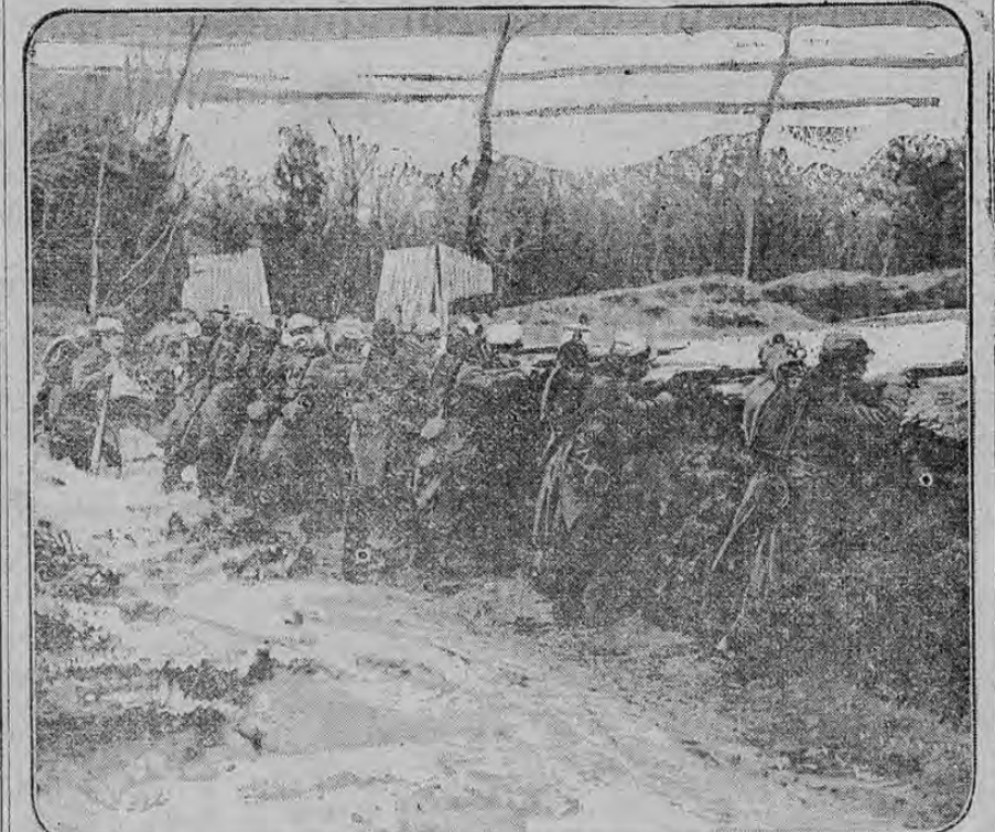
FRENCH INFANTRY BEHIND TURF WALL

Esta fotografía fue tomada al principio de invierno cuando comenzaba a caer la primera nieve. Antes de que los soldados se retiraran a sus trincheras de invierno, se libraron muchas batallas.